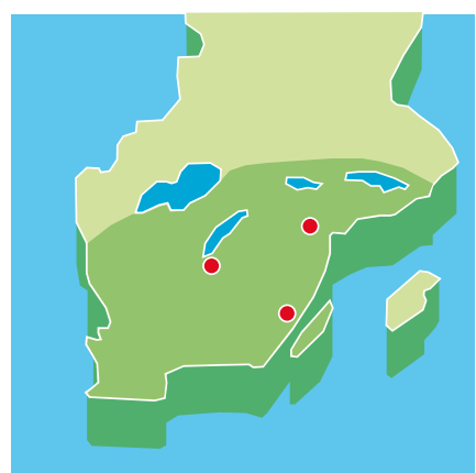
Våra kunder finns från Mälardalen ner till Skåne. Från kust till kust.

I augusti 2011 blev det klart att Mårdskog & Lindkvist och Matgrossisten går samman vid årsskiftet. Resultatet blir tre lokala grossister som utgår från Jönköping, Norrköping och Kalmar. Tillsammans kommer vi att serva professionella matlagare från Mälardalen ner till Skåne. Från kust till kust.